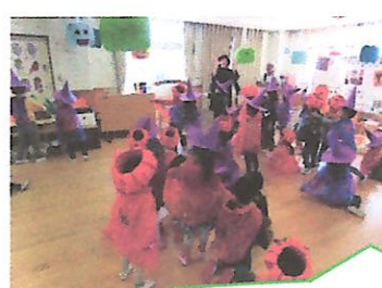
ハロウィンの歌を歌ったよ♪