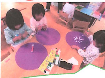
帽子やマントを作っているよ！！