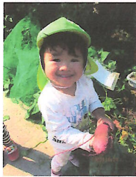
おいもとれたねー